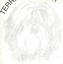
TERRIER DU TIBET